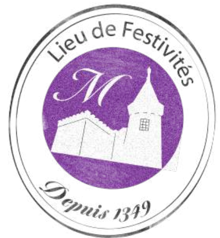
Château de Montolivet- route du Château-38510 Passins-