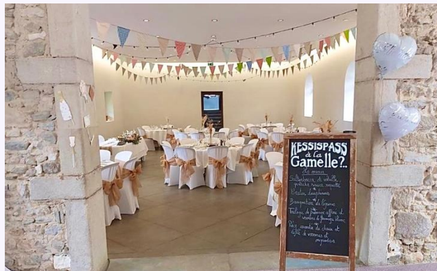
La salle de l'Hostellerie (170 m2)