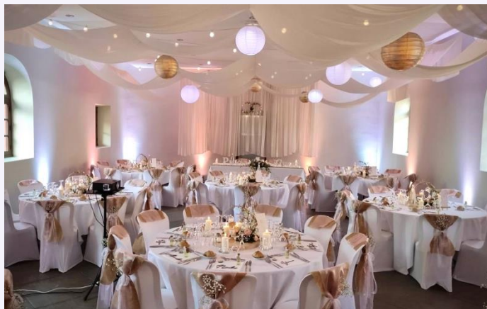
La salle de l'Hostellerie

Plusieurs espaces de réception (repas et soirée dansante) sans limitation d'heure, pouvant accueillir jusqu'à 350 convives