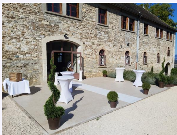
La terrasse de l'Hostellerie

Le mardi, la grande salle voûtée modulable de 400 m2